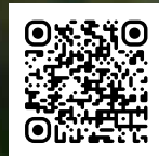
Itinéraires de Txakoli